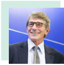
David Sassoli, den Präsidenten des Europäischen Parlaments

Die Konferenz findet unter dem gemeinsamen Vorsitz der drei EU-Organe statt, die jeweils durch