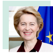
Ursula von der Leyen, die Präsidentin der Europäischen Kommission