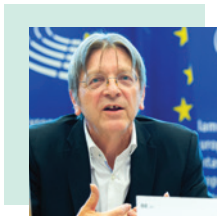
Guy Verhofstadt, Mitglied des Europäischen Parlaments

Der gemeinsame Vorsitz wird von einem Exekutivausschuss unterstützt, dessen Vorsitz ebenfalls gemeinsam von den drei Organen geführt wird: